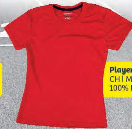
Playera Runners dry & cool Dama CH | M | G | XG | XXG 100% Poliéster - Microfibra

Diseñada bajo el concepto de alto rendimiento que por las características de la tela microporo y su tecnología dry & cool permite la rápida evaporación de la humedad manteniendo la prenda fresca y seca.