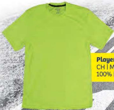
Playera Runners dry & cool Caballero CH | M | G | XG | XXG 100% Poliéster - Microfibra